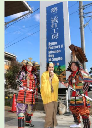
↑ ↓ 参加者で賑わう メイン会場（第2流灯工房）