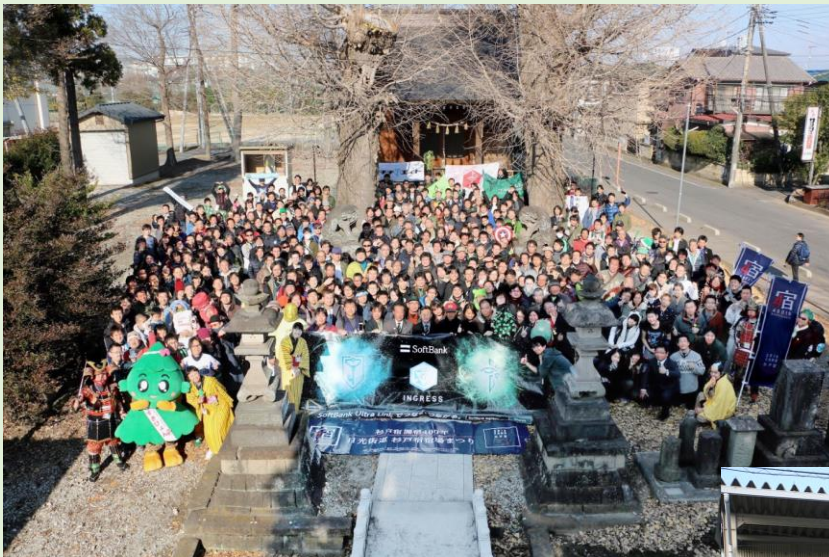
↑ ウェルカムセレモニーでの記念撮影 (於 杉戸町 近津神社境内)

なお、「Mission Day 埼玉六宿」は、日光街道埼玉六宿（草加宿、越ヶ谷宿、粕壁宿、杉戸宿、幸手宿、栗橋宿）を舞台とした「Ingress」公式イベントであり、埼玉県内初のものであった。