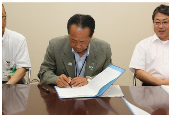
(2) 協定書を取り交わす古谷町長