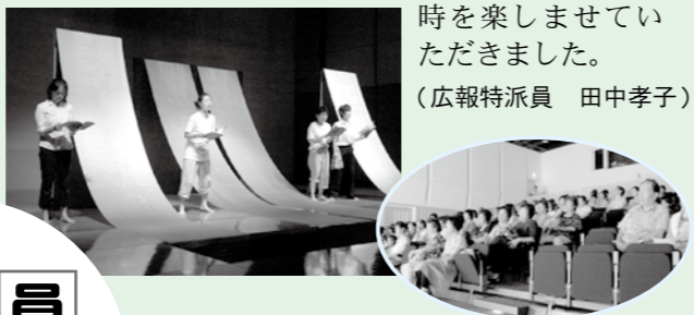
(広報特派員 田中孝子)

劇団ポップコーンの皆さんは、旗揚げ12年目を迎えたアマチュア劇団。各地の幼稚園・保育園、子ども会等で、その生の舞台に触れたお子さんも多いことでしょう。今回は、舞台装置を効果的に使った、大人を対象とした朗読劇でした。ひと昔前の貧しいけれどたくましく生きる「あんちゃんのたんぼ」、歌とピアノと朗読の共演が新鮮な「スーホの白い馬」…生の舞台から伝わる熱気と素晴らしい歌声に、連日の暑さも忘れ、心潤う真夏の午後のひと時を楽しませていただきました。