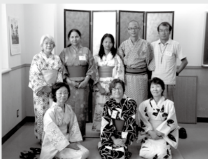
(広報特派員 大塚 美恵子)

先生は、日本語教室のボランティアさん、生徒は日本語教室に通う生徒さんです。初めて着るゆかたはちよつと苦しうでしたが、みなさん色とりどりのゆかたを着せてもらい、とても楽しそうでした。ゆかたを着たまま授業を受け、夏の日よいよ思い出になったようです。