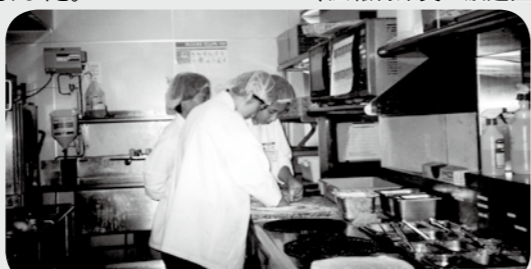
(広報特派員 渡邊直子)

普段の授業では体験できない社会のしくみや事業所の様子を、生徒の皆さんそれぞれが肌で感じとり学んでいるようでした。この活動が、将来の進路を考える際に何かしらの役に立つことを期待しました。