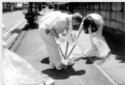
50人くらいの方が参加し、40分程かけて行なわれています。 (広報特派員 渡邊直子)

杉戸高野台にある凸版印刷株式会社総合研究所の職員による、地域のクリーン作戦が毎月1回行なわれています。これは、社会貢献の一環として、日ごろお世話になっている地域へ恩返しを、と昨年度より始められたそうです。清掃は、会社周辺から杉戸高野台駅の方へ向かったり、コースを変更してみたりと毎回