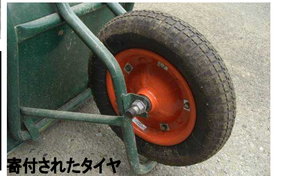
寄付されたタイヤ

社会体育で校庭を使用している、野球クラブ「フェニックス」さんから、一輪車のタイヤ5本寄付いただきました。大切に使用させていただきます。ありがとうございました。