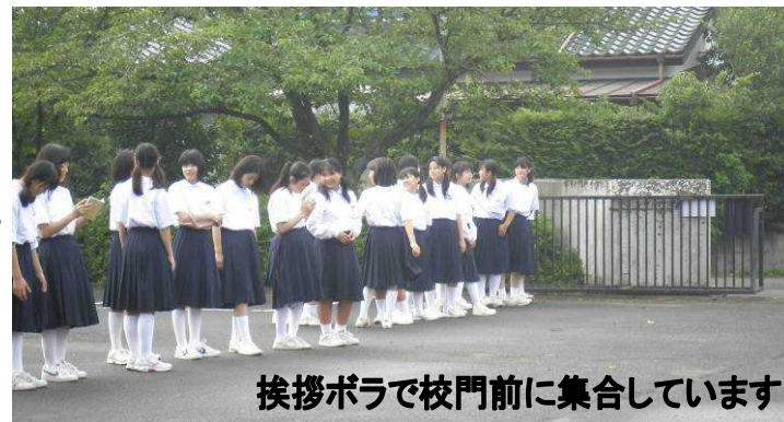
挨拶ボラで校門前に集合しています