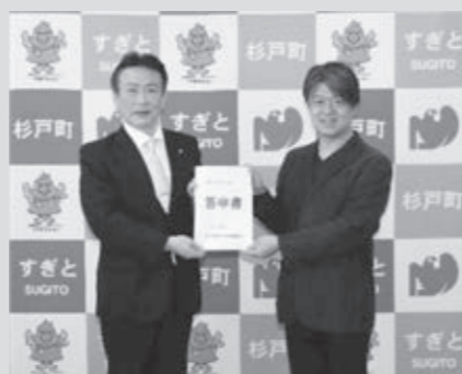
○杉戸町新庁舎整備審議会より答申