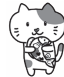
「恋たま」イメージキャラクター たまきち

対象 ・結婚を希望し、自ら婚活する意思のある20歳 以上の独身男女 ・県内に在住・在勤、または近い将来移住をお 考えの方 ・電話回線のあるスマートフォンをお持ちの方