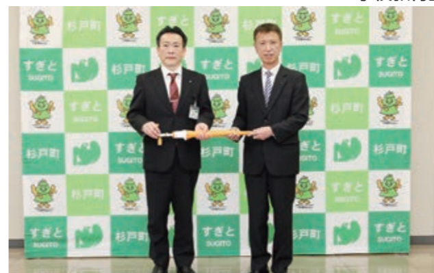
傘は、各学校を通じて、1年生の児童に配布されます。

埼玉みずほ農業協同組合様より、町内の小学校へ入学する児童へ、「児童用のオレンジ色の傘」350本の寄贈をいただきました。 ㊦学校教育課