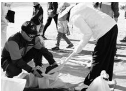
西小学校地区防災訓練

また、令和6年4月、コティすぎと1階に開所した杉戸町コミュニティセンターにおいて、各種事業を展開することで人々の交流を促進し、賑わいの創出に努めます。