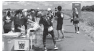
マラソン大会給水