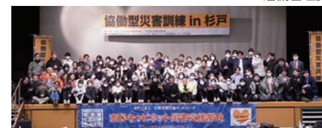
フェムテックとは、Female（女性）とTechnology（テクノロジー）をかけあわせた造語で、女性特有の課題をテクノロジーで解決できる商品やサービスのことを指します。発災時や避難所では、様々なテクノロジーを用いてよりポーターレスな支援を行うことが求められています。