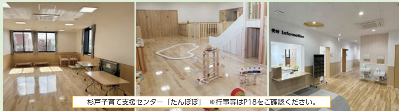
杉戸子育て支援センター「たんぼぼ」 ※行事等はP18をご確認ください。

平成30年度から検討が始まった「旧杉戸小学校跡地活用事業」は、令和6年3月31日をもって施設の整備が完了し、令和6年4月1日から「ココティすぎと」としてオープンしました。生まれ変わったエリアをぜひご利用ください。