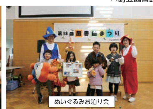
ぬいぐるみお泊り会