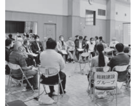
前回(昨年度)の様子

詳細については、議会ホームページをご覧ください。皆さんの奮ってのご参加をお待ちしています。