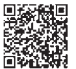
▲出張登録会について (町ホームページ)