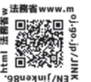
法務省 www.m j-go-jp/jink html 法務省 EN/jinken86

部落差別とは、被差別部落に「住んでいる」あるいは「生まれた」ということを理由とした不合理な偏見により、結婚や就職、日常生活などの面で差別を受け、基本的人権が侵害されるという、日本の歴史の中で生み出され、現在もなお存在する我が国固有の重大な人権問題です。埼玉市町では「部落差別の解消の推進に関する法律」や「埼玉県部落差別の解消の推進に関する条例」を踏まえ、部落差別に対する正しい理解が図られるよう、人権教育・啓発活動を推進しています。