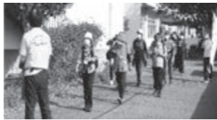
ウォーキング大会誘導

※すぎスポでボランティア活動をする場合は、 すぎスポ会員登録（入会金無料） とボランティア登録を させていただきます。活動日時・場所・内容について、すぎスポ事務局と相談の上、活動する仕組みです。 なお、ボランティア登録は高校生以上の方を受け付けています。