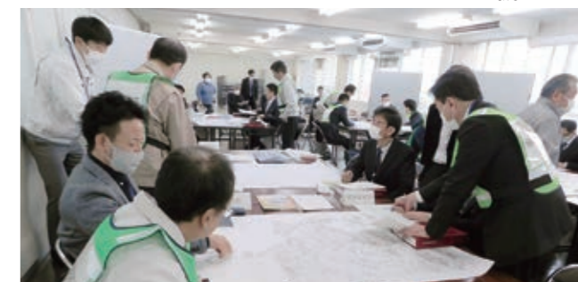
訓練当日は、平成22年に杉戸町と友好都市を締結した福島県富岡町の職員3名を訓練講師として、過去の災害による経験をふまえた助言・指導をいただきました。