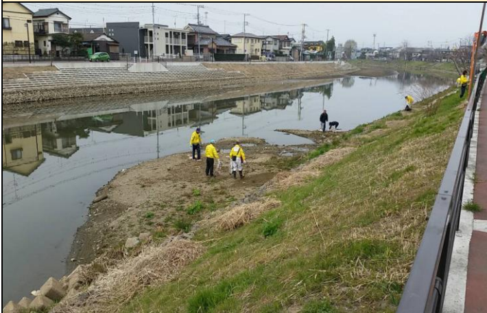
③ 大落古利根川を清掃する参加者