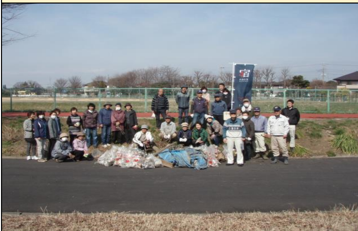
⑤ 清掃終了後に記念撮影 高野団地の皆様