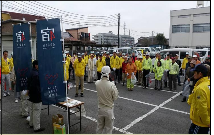
② 杉戸町役場 開会式の様子 2