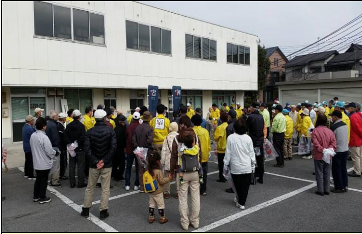
① 杉戸町役場 開会式の様子 1