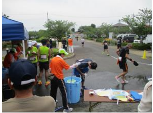
(2) ランナーの疲れを癒す