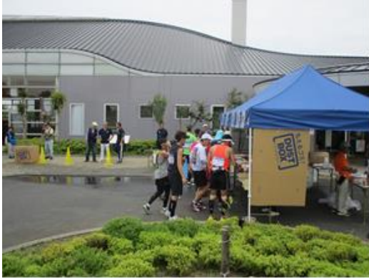
(1) エコ・スポいずみに給水所開設