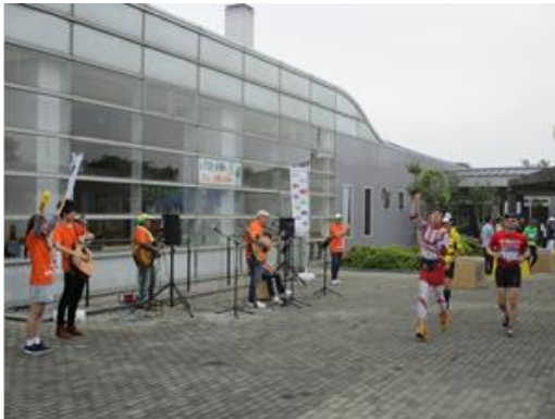
(3) バンド演奏でランナーを鼓舞する