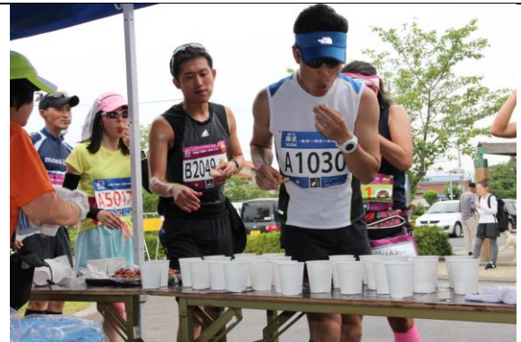
(6) ランナーに地産品を