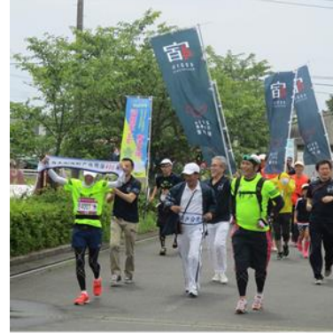
(8) 伴走によりランナーに鋭気が蘇える