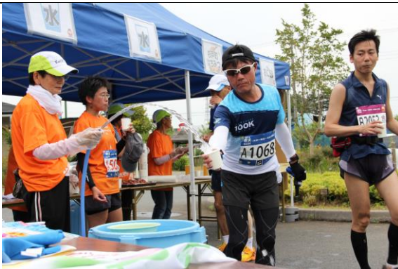
(5) ランナーに水分を