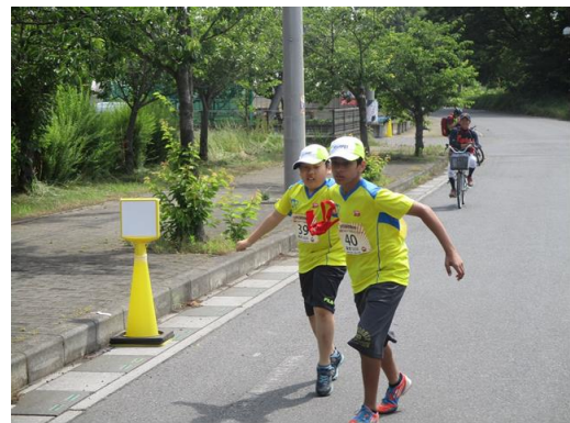
(4) 地元小学生もリレーで繋ぐ