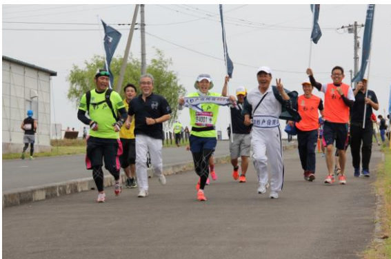
(7) 古谷杉戸町長（前列右の白帽子）らも伴走