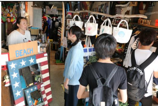
① フィールドワークで町内を巡り、店舗での情報収集を行う共栄大学学生