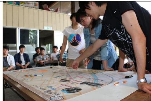
② フィールドワークの成果をマップに落とし込む共栄大学学生