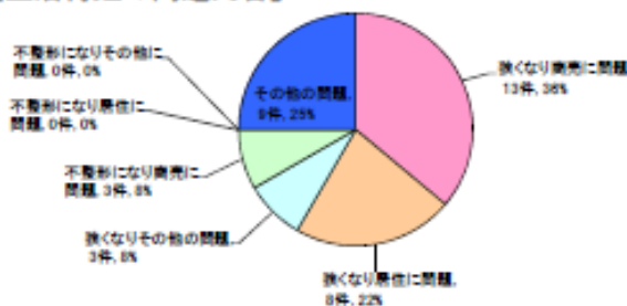
【生活再建の問題内容】