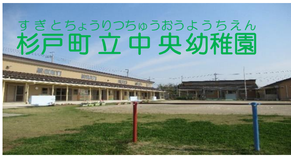
すぎとちょうりつちゅうおうようちえん 杉戸町立中央幼稚園