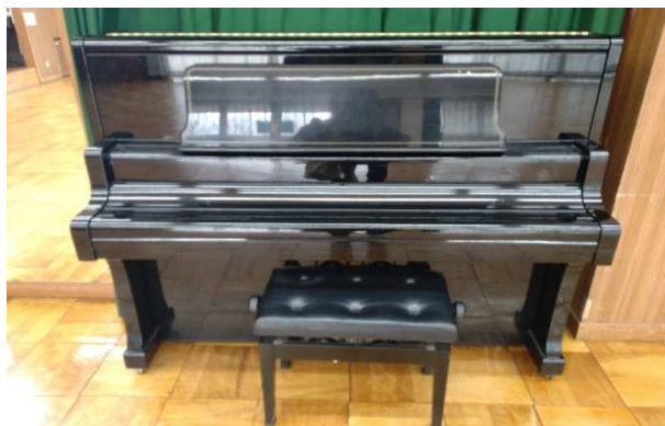
▲ アップライトピアノ 1台