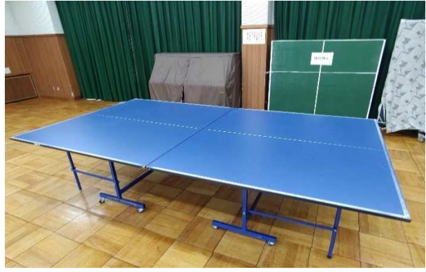
▲ 卓球台 (うち1台は障がい者用) 2台