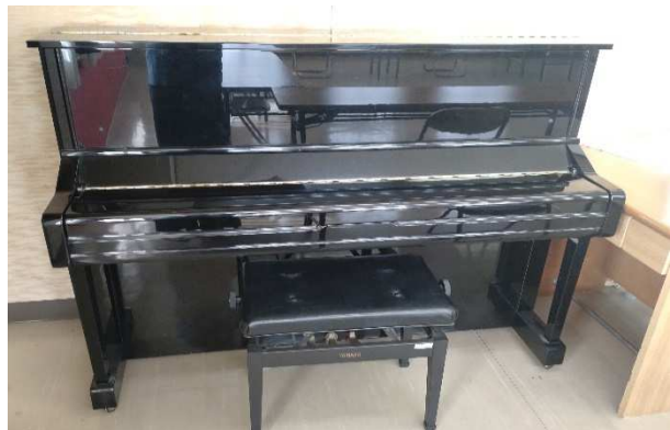
▲ アップライトピアノ 1台