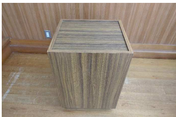
▲ 花台 1台