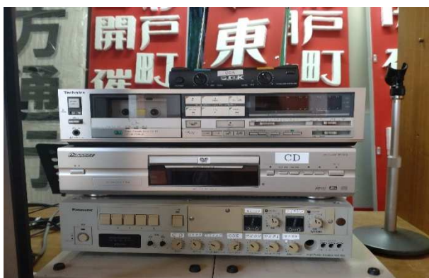
▲ 音響設備 一式(CDデッキ故障中)