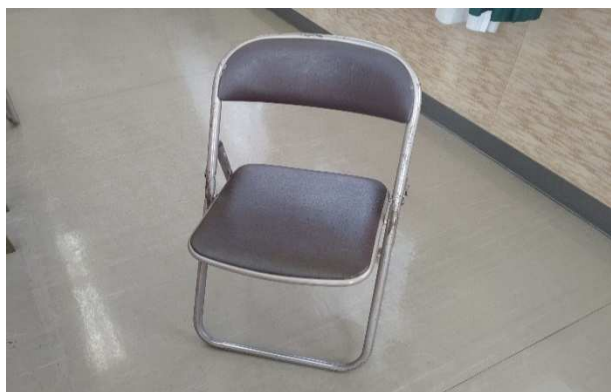
▲ パイプ椅子 20脚