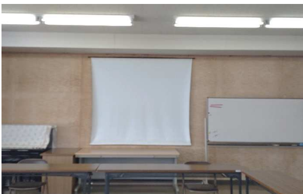
▲ スクリーン 1面