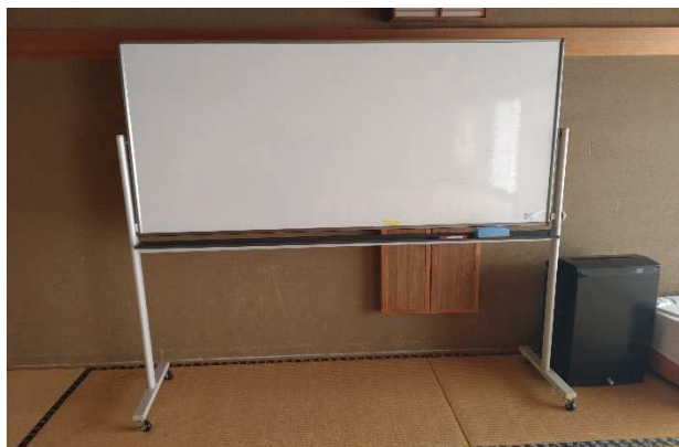
▲ ホワイトボード(移動式)