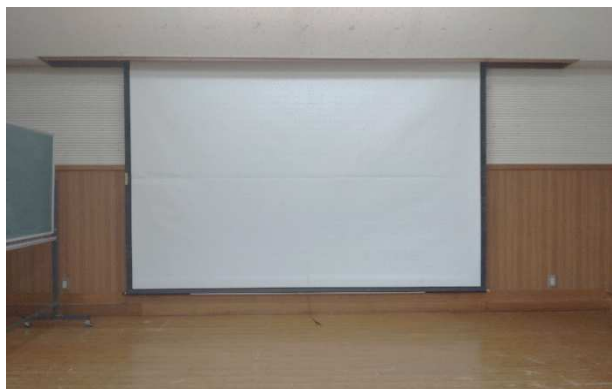
▲ スクリーン 1面