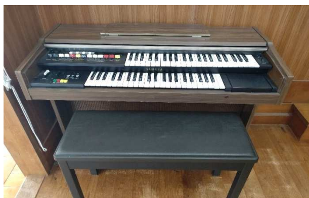
▲ 電子ピアノ 1台