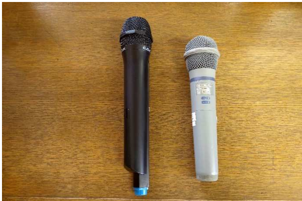
▲ マイク(ワイヤレス) 2本