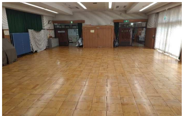
▲ 内観(ステージ側から)