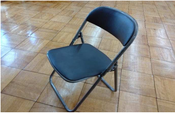
▲ パイプ椅子 100脚