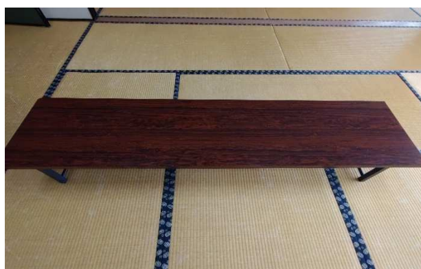
▲ 折りたたみ机(座卓) 20脚