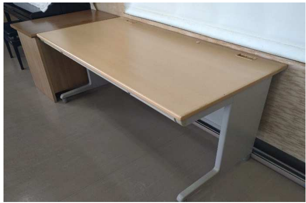
▲ 机(大) 1脚