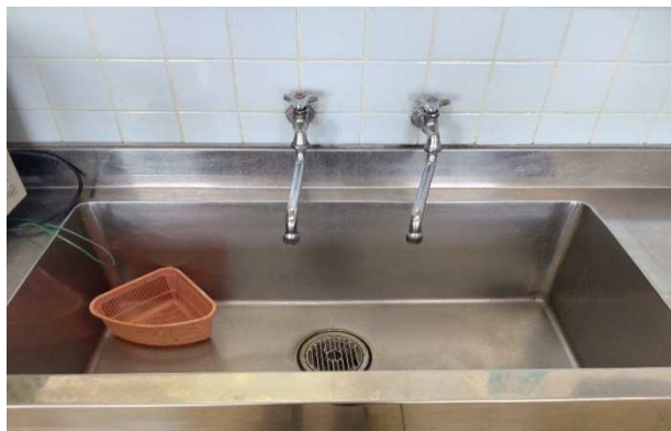
▲ 流し場 (実習室壁側)