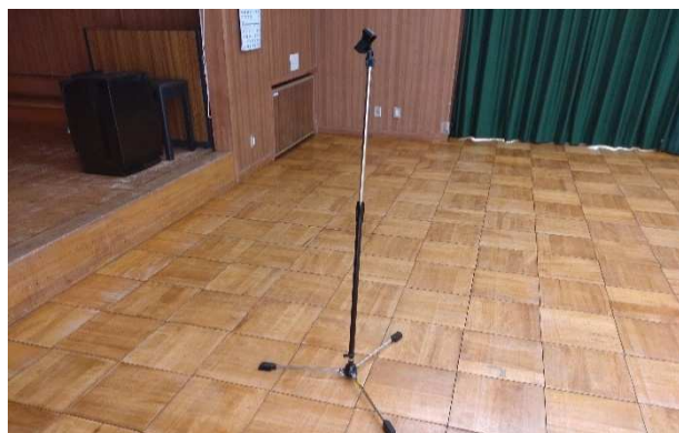
▲ マイクスタンド(大) 1本