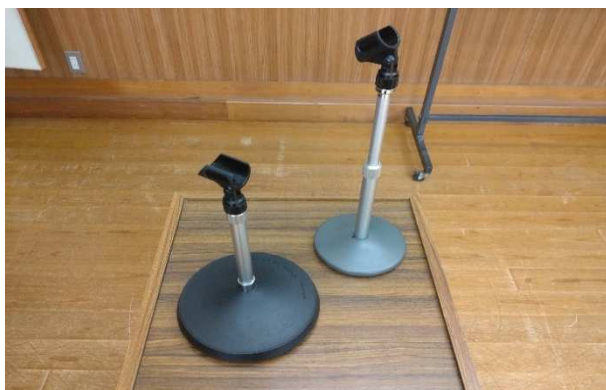
▲ マイクスタンド(卓上) 2本