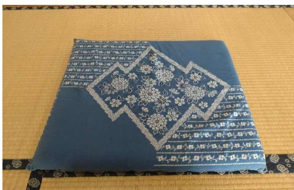
▲ 座布団 50枚