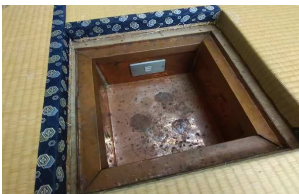
▲ 炉(電気式) 1基