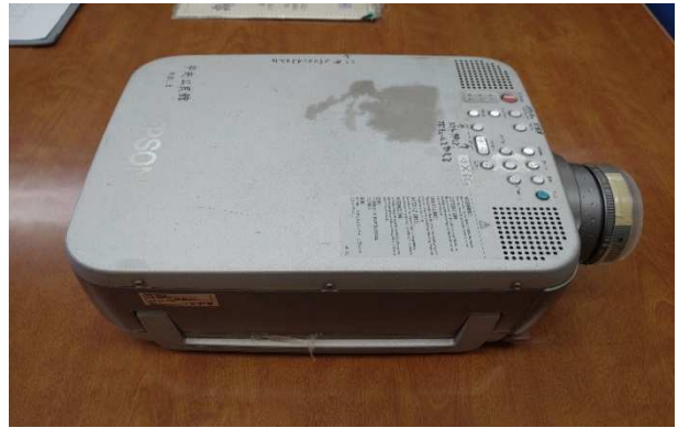
▲ プロジェクター 1台