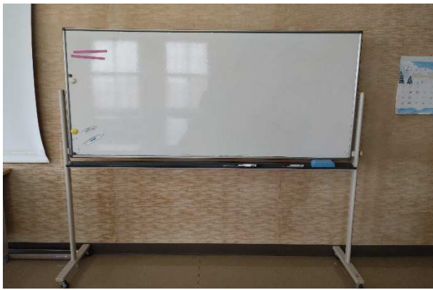
▲ ホワイトボード(移動式) 1台