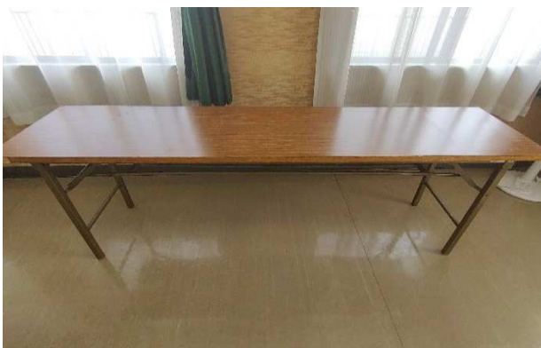
▲ 折りたたみ机 10脚