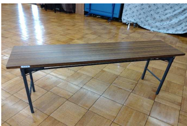
▲ 折りたたみ机 16脚