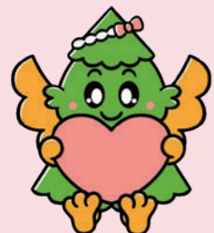
杉戸町マスコットキャラクター すぎびよん

E-mail sugito.community@machikatsu.co.jp