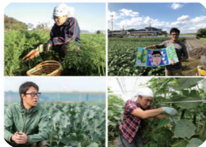
杉戸町若手農家の皆さん

ココティで定期的に行われている「みんなの朝市」でもお馴染みの杉戸町の若手農家の皆さんによる農業にまつわるお話です。杉戸町で農業を始めたきっかけや苦労話など、農家の皆さんの実体験を元にお話いただきます。農業に関心がある方におすすめです。