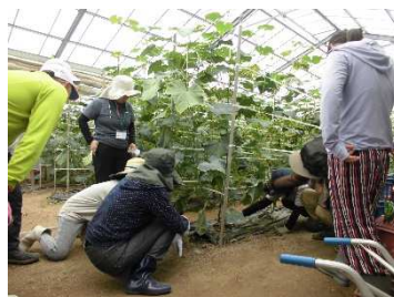
きゅうり農家で実習