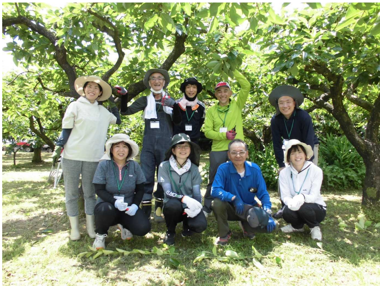
令和7年度農のサポーター一育成塾の塾生と講師