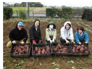
さつまいもの収穫