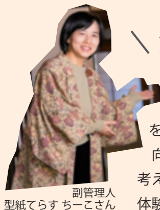
副管理人 型紙でらすちーこさん

今後は、地域の方々と連携し、おからパンづくりや絵本づくり、型染め（型紙を彫り、布などを染める工芸）、女性向けマッサージなど、宿泊者向けのワークショップやリラクゼーションの提供も考えているそう。泊まるだけでなく、わくわくできる体験や町そのものを楽しめる場所を目指しています。