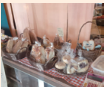
オープンデーに販売されている楽ぱんさんのおからパン