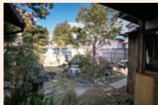
八緒やど1階の8畳2間の和室（写真上）と、落ち着いた雰囲気のお庭（写真下）。