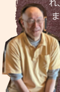
写真提供：八緒やど／撮影：株式会社スマイルプロアート 西野あきひろ（一部、コミュニティセンタースタッフ撮影）

「八緒やど」の建物は、大正6年頃に建てられ、かつては金物店として親しまれていました。店を畳んだ後も、町の人たちの働きかけにより、イベントやフリーマーケットが開かれ、人が集まる場所に。「千載一遇の出会いで残してもらえて嬉しいですね」と、家主の渡辺さんは話します。