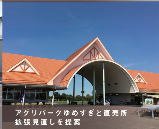
アグリパークゆめすぎと直売所拡張見直しを提案