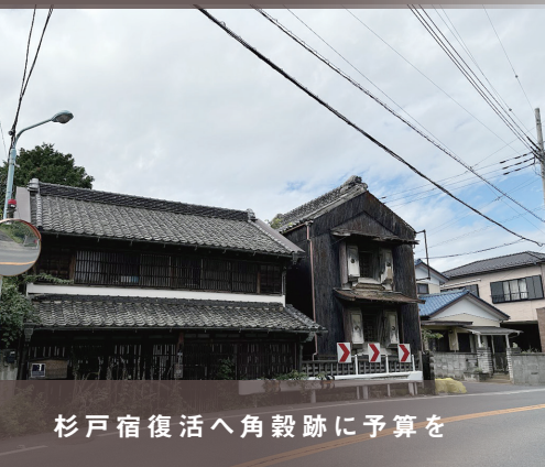
杉戸宿復活へ角穀跡に予算を