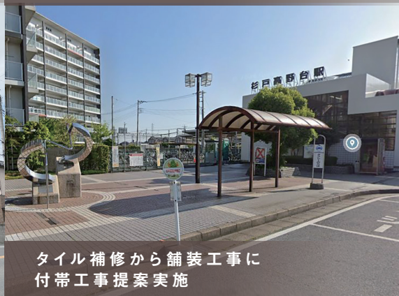
タイル補修から舗装工事に付帯工事提案実施