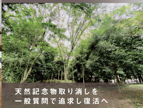
天然記念物取り消しを一般質問で追求し復活へ