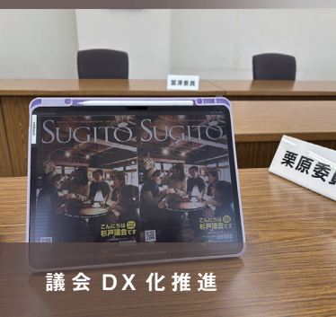
議会 DX 化 推 進