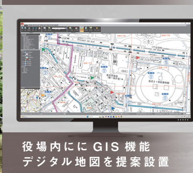
役場内に GIS 機能 デジタル地図を提案設置