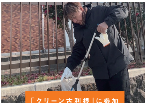
「クリーン古利根」に参加

皆様の応援のおかげをもちまして、2023年8月に議員となり、 議会で行ったことや普段取り組んでいる主な活動を報告します。