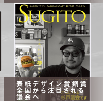
表紙デザイン賞銅賞 紙から注目される 全国会へ