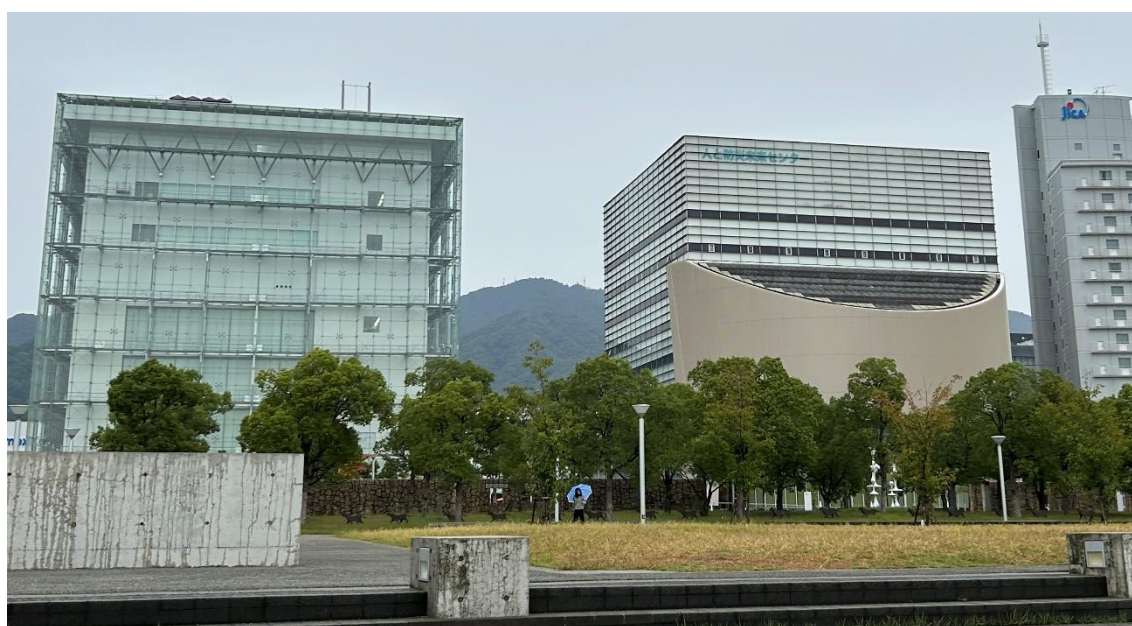
阪神・淡路大震災記念 人と防災未来センター 写真左側が西館・右側が東館

この度は「阪神・淡路大震災記念 人と防災未来センター」を視察させていただき、阪神淡路大震災からの学びを参考に、「自助・共助・公助」の役割を調査研究させていただきたいためです。