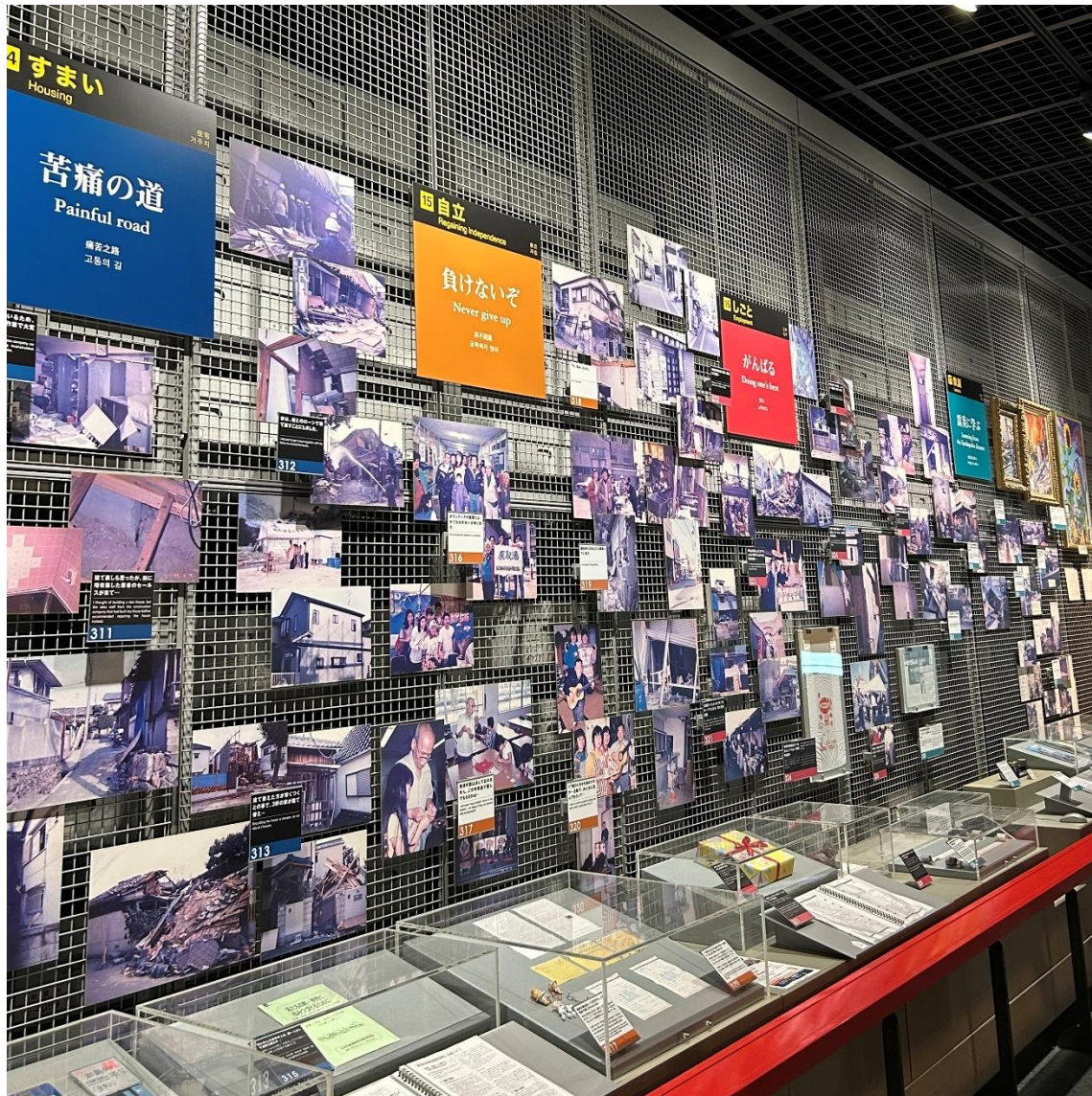
阪神・淡路大震災記念 人と防災未来センター 内観の一部