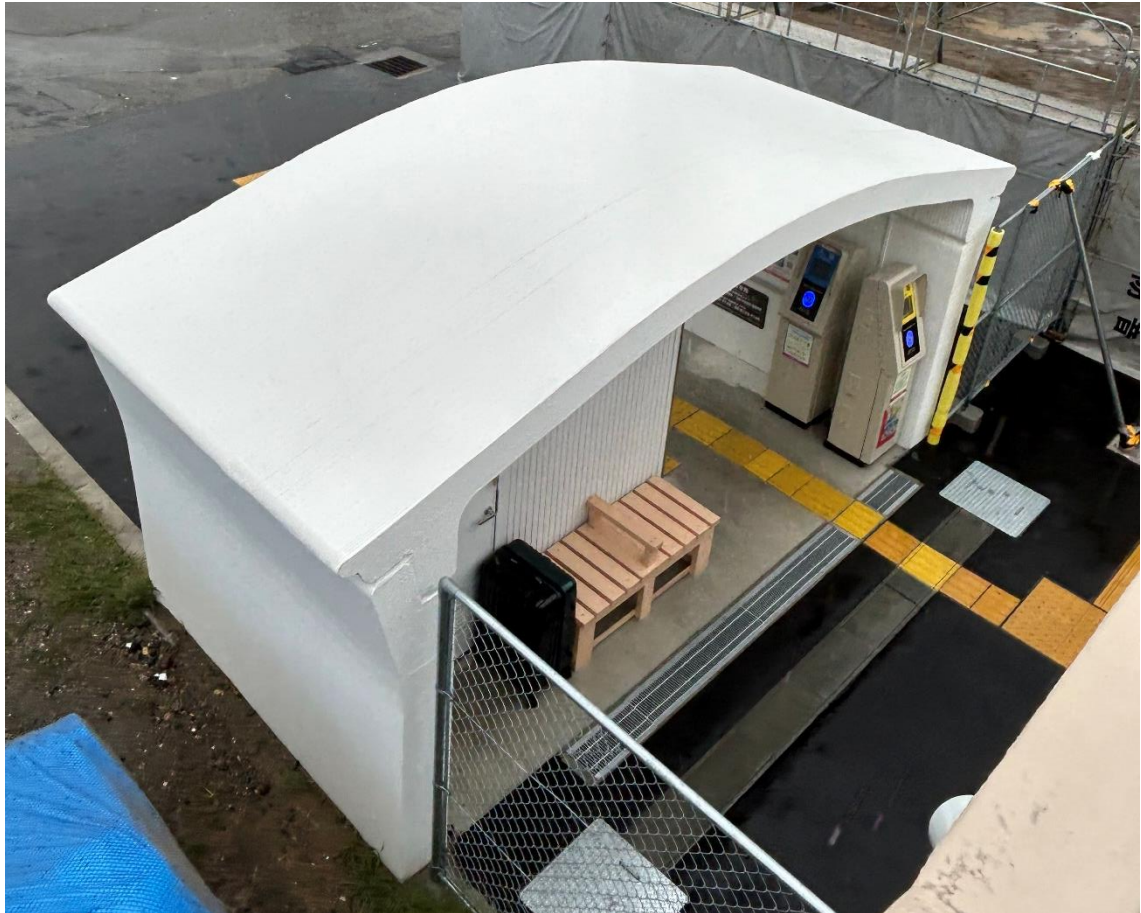
J R初島駅 上から