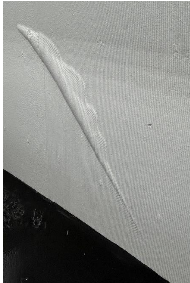
駅舎にプリントされた「みかん」と「たちうお」