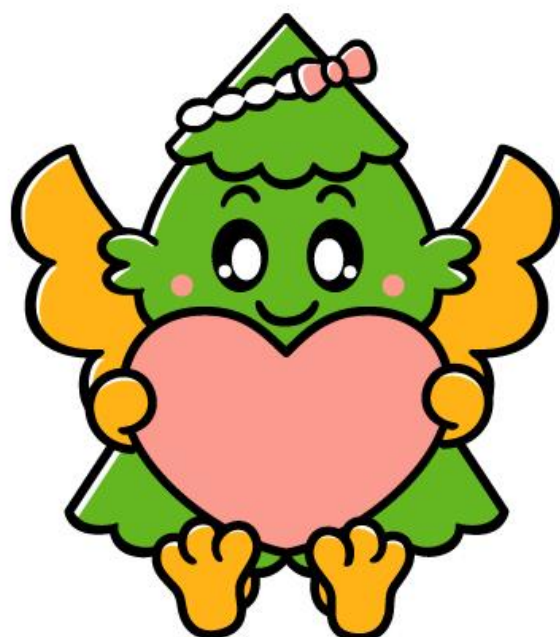
杉戸町マスコットキャラクター「すぎびよん」