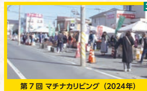
第7回 マチナカリピング (2024年)

3 宮代町との共同開催。東武動物公園駅東口通線を拡幅した空間で出店イベント。 4 公共空間で「やりたいこと」を募り、コンペ形式で実践。写真は校庭での「週末ラジオ体操」。