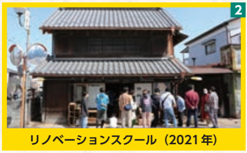
リノベーションスクール (2021年)

「あ、この場所に行ったことがある」「このイベントに関わったことがある」——そんな記憶が浮かんだら、あなたもこのまちを育ててきた一員です。 まず、この地域でどのような取り組みが行われてきたのか、略年表をご紹介します。 「あ、この場所に行ったことがある」「このイベントに関わったことがある」——そんな記憶が浮かんだら、あなたもこのまちを育ててきた一員です。