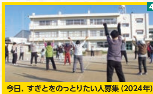
今日、すぎとをのっとりたい人募集 (2024年)