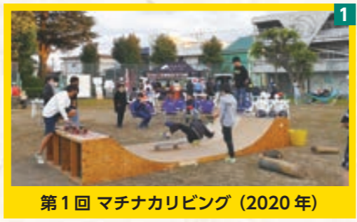
第1回 マチナカリピング (2020年)