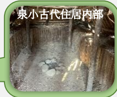
泉小古代住居内部