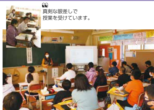
真剣な眼差しで授業を受けています。