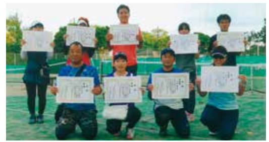
▲第31回混合ダブルス大会表彰式

ラケットと運動靴があればすぐにできます。初心者は壁打ちやコーチの指導で上達し、試合の仲間入りができます。試合はボールを追いかけ、足腰・呼吸器・内臓の鍛錬が無意識のうちにでき、試合中のボールのラリーやサーブ、守備位置等々を意識することで認知症予防にもつながると思います。