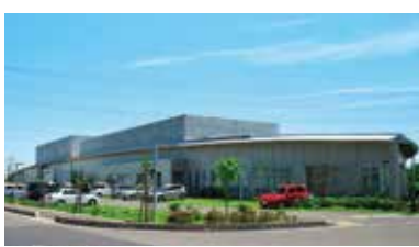
▲現代の恭儉舎（カルスタすぎと）