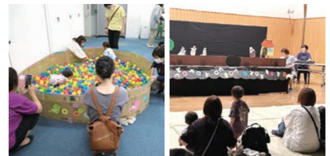
当日は、133名が来場されました。子育て家庭から小学生以上の児童・生徒など全ての方が楽しめるイベントとなりました。

生涯学習センター(大字大島)にて、「絵本と遊びの演奏会」が開催されました。遊びコーナーや読み聞かせコーナー、バイオリン演奏などが実施され、子育て支援センターが生涯学習センター内に移転中の今しかできないイベントとなりました。