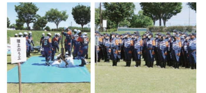
当日は、利根川栗橋流域水防事務組合の水防団員など約350名が出勤し、真剣な眼差しで訓練を行いました。

杉戸町消防団(水防団)では、権現堂公園(1号公園・幸手市)にて、水防訓練を実施しました。訓練では、土のうを使用した水防工法を行い、水防活動に必要な知識と水防技術の習得を図り、台風やゲリラ豪雨などの水害に備えました。