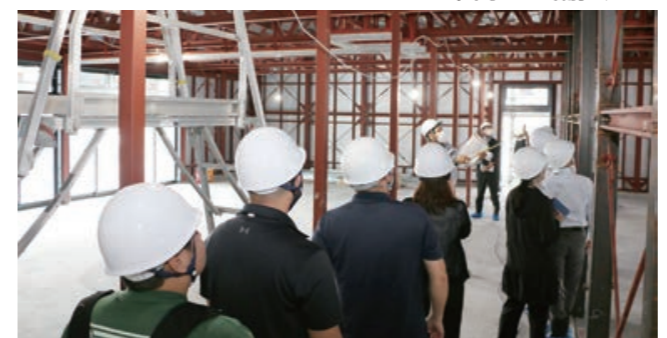
現在、複合施設や広場、都市公園等の整備が進行中です。令和6年3月にオープニングセレモニー、4月に開設予定となっています。

ココティすぎと(旧杉戸小学校跡地・杉戸3丁目)に建設中の複合施設の現場見学会が開催されました。日本工業大学の生徒などが参加し、事業の概要や複合施設の建設の流れなどの説明を受けました。