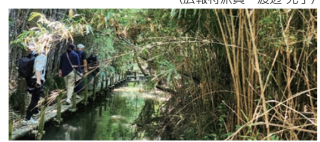
※6月25日(日)に開催された「第19回杉戸アースデー」にてネイチャーウォーキングとして南側用水路の木道と下野の森を散策しました。

平成30年に彩の国埼玉環境大賞優秀賞を受賞した南側用水路清流プロジェクトは、世界一の里川に育て上げたいという思いから活動しています。環境を維持するため、毎月第1・3土曜日に清掃活動等を行っています。(広報特派員 渡辺 光子)