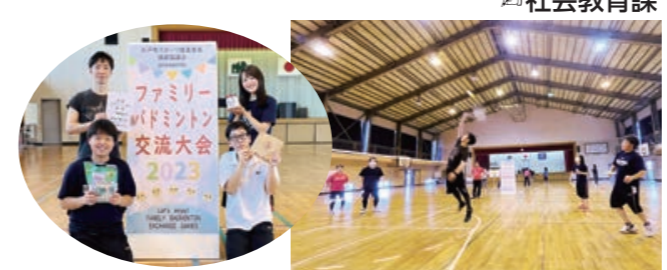
優勝「タスティエーラ」、準優勝「MINTON」、第3位「リパティ」「S&S」 ファミリーバドミントン教室 毎週土曜日 10時~12時 杉戸小学校体育館 参加費無料 ※参加を希望する方は事前に社会教育課までご連絡ください。

杉戸小学校(内田2丁目)にて、「ファミリーバドミントン交流大会2023」が開催されました。腕に自信あり!の6チーム総勢24名の参加者たちが、各々の戦略で試合に臨み、終始賑やかな雰囲気の中で熱戦を繰り広げました。