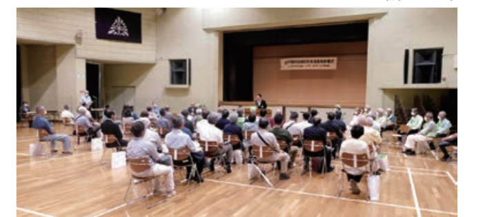
防犯推進委員は、登下校の子どもの見守りや夜間パトロールのほか、年間を通じて警察や町とともに防犯活動に取り組み、地域の安全を見守っています。

進修館(宮代町)にて、令和5年度杉戸管内地域防犯推進委員委嘱式および研修会が開催されました。杉戸町・宮代町から新たに76名の地域防犯推進委員が委嘱されました。