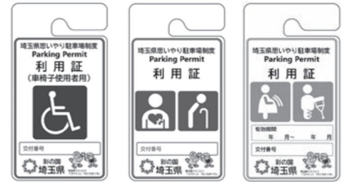
車椅子使用者用 その他障害者、要介護者等用 妊産婦、けが人用