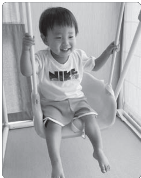
掲載された方には、掲載号の広報紙と共に、お子様の写真を広報表紙デザインに当てはめた特製カードをプレゼント♪