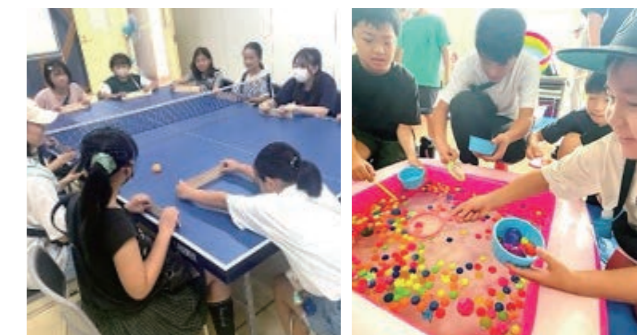
当日は、お子さんからご高齢の方まで約200名の参加がありました。