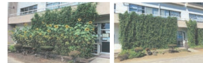
団体部門 最優秀賞