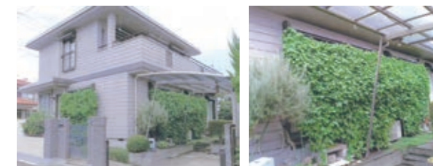
個人部門 最優秀賞