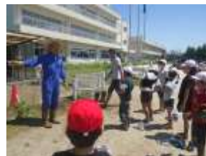
1年 生活科 倉松公園