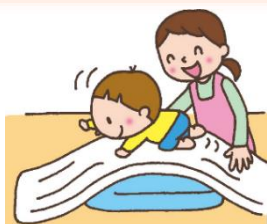
友達をもちあげて運ぶよ